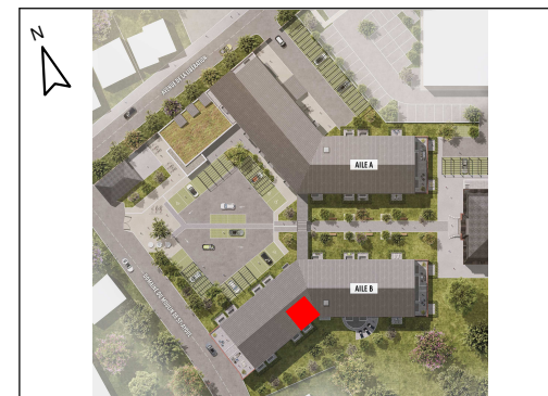
T2 - N° B3.01